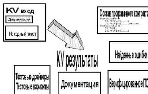
Рис. 2. Общая схема KVEST технологии

генерируются на основе спецификаций и MDC. После завершения генерации дополнительная модификация тестовых наборов не требуется.