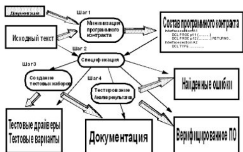
Рис. 1. KVEST методология – шаги и результаты