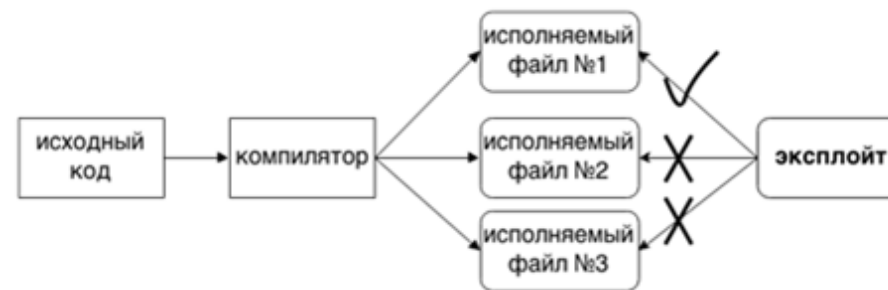
Рис. 1. Схема атаки на диверсифицированную популяцию исполняемых файлов.

В современном мире большое количество программного обеспечения распространяется через магазины приложений различных платформ (Apple's App Store, Android Marketplace, Windows Market). В такой схеме распространения без труда можно осуществить автоматическую генерацию уникальной копии бинарного кода приложения по запросу пользователя. Злоумышленник, загрузив из магазина приложения одну из копий бинарного пакета, создаст для своей версии приложения эксплоит. При попытке атаки другие копии данного приложения не будут скомпрометированы этим эксплойтом (рис. 1).